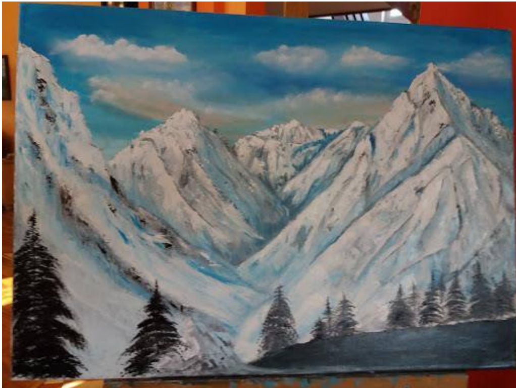
Zał. Nr 5 – prace plastyczne moich uczniów wykonane na lekcji.