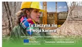
Kształcenie i szkolenia zawodowe – VET