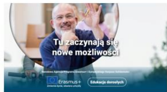
Edukacja dorosłych – ADU