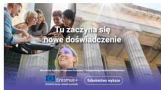
Szkolnictwo wyższe – HE