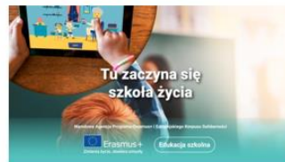
Edukacja szkolna – SE