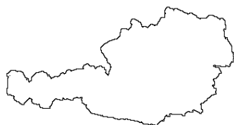
Austria - G