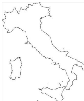
Włochy – R