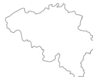
Belgia - G R