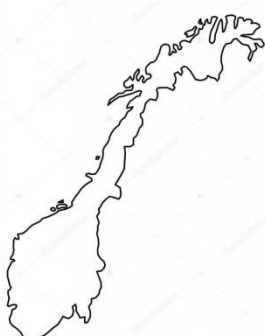
Norwegia - G