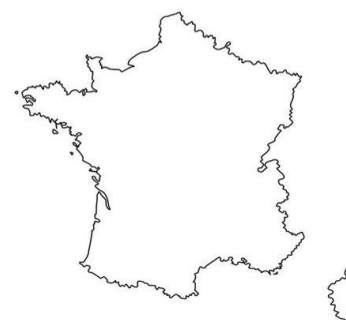
Francja - R