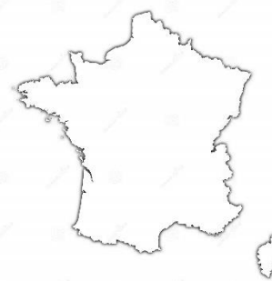
Francja - R