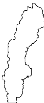
Szwecja - G