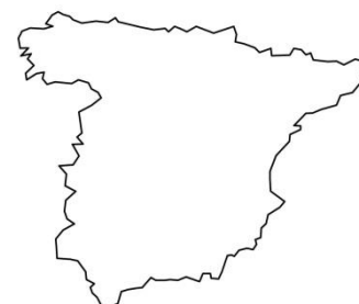
Hiszpania - R