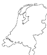
Holandia - G